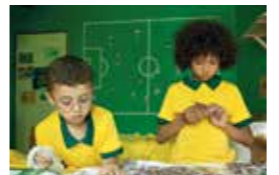
MARADONA'S LEGS | DEM