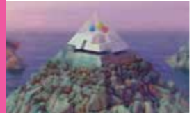
SHIFT SIMMERS SLIPS | HW