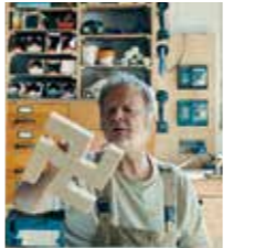
KOLLEGEN | HW