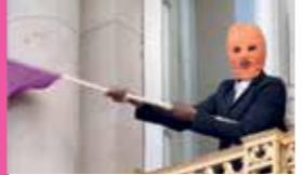
TOP DOWN MEMORY | HW

filmzeit -Matinee mit prämierten Filmen in Kaufbeuren, Kempten und Immenstadt!