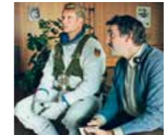
INTERKOSMOS | HW