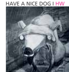
HAVE A NICE DOG | HW