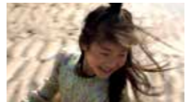
MEISJESJONGENS MIX | DOK