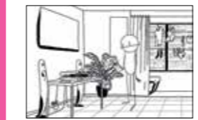
BREAKING BERT | HW