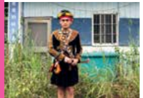
PALISIAN | DOK