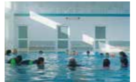
SEEPFERDCHEN | DEM