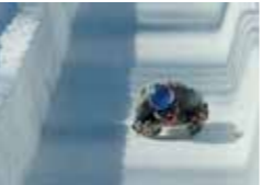
HAEBERLI | DEM